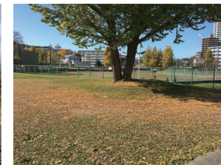
評定河原の銀杏の木