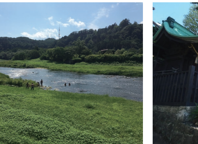
七夕の時期、藤坂織姫神社に毎年飾られる七夕飾り