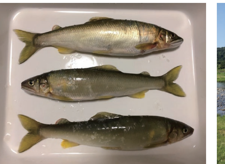
投網漁をしていた近所の人におすそ分けしてもらった鮎