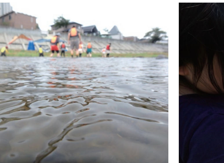
真夏の暑い日、川の中から愉快的な太鼓の音が響いてきた