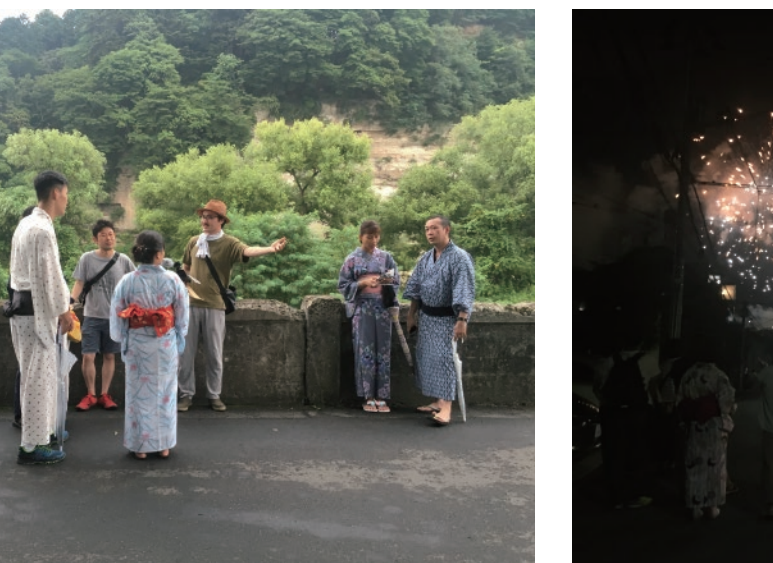
七夕前夜、浴衣を来て留学生のみなさんとまちあるき