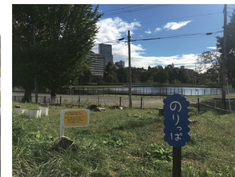
2019年台風19号時は、評定河原球場が湖になっていた