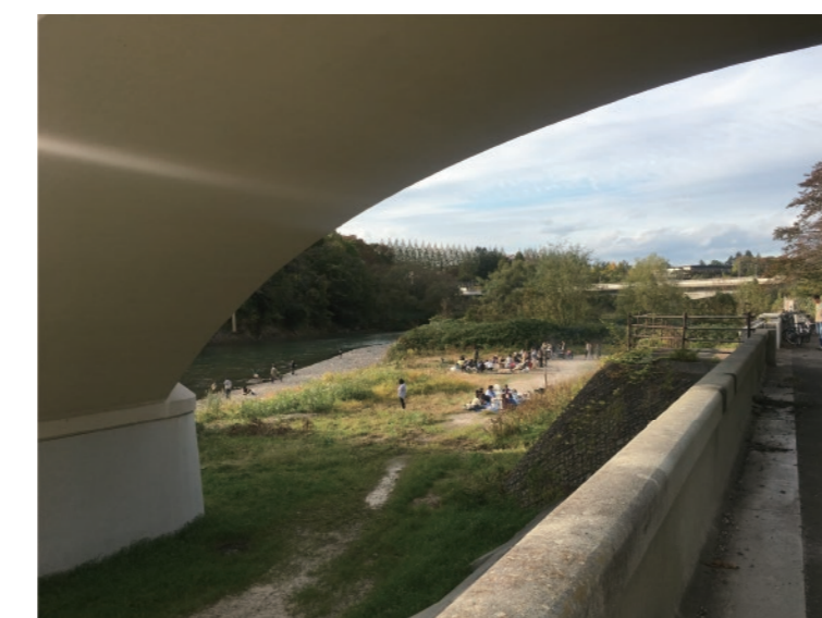
地下鉄ができてから、近所で芋煮をする人が増えた