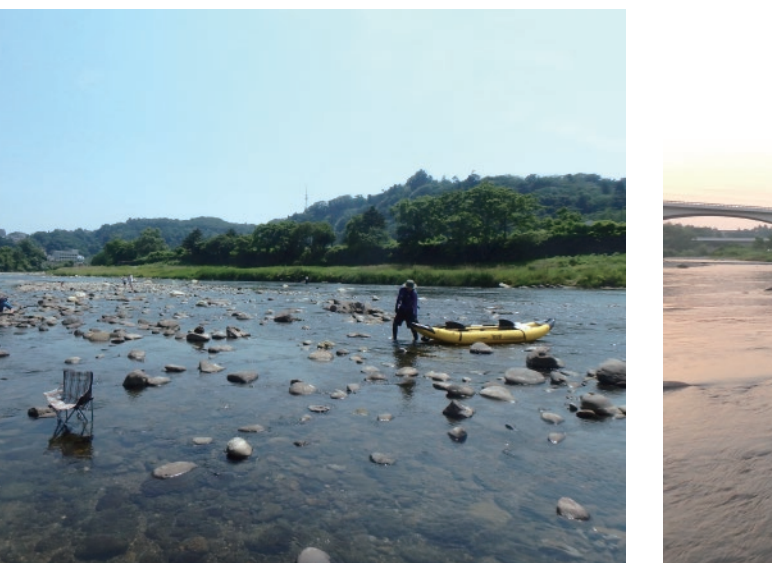
川遊びをしていた知人からコーシーをいただく