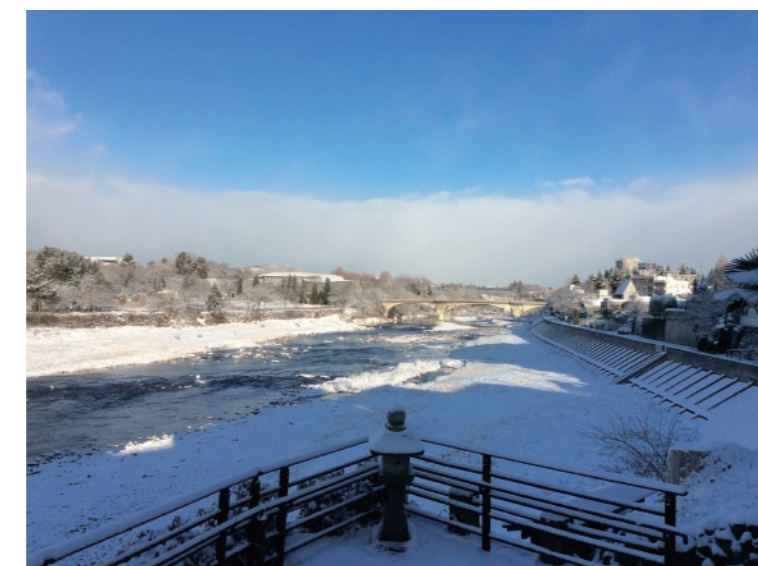
冬の日、朝起きて家を出ると、目の前に真っ白な景色が広がる