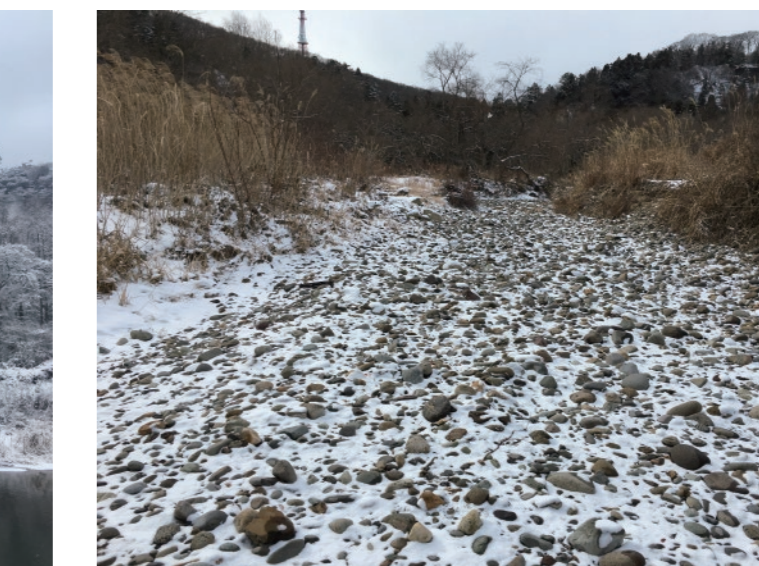
冬は草が枯れて、河原の奥の方まで探検がしやすい