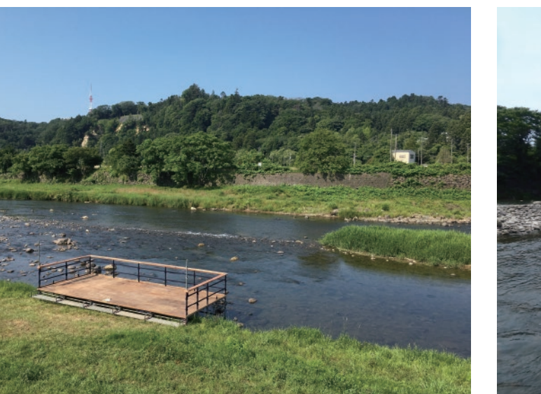
2017年7月に期間限定で出現した川床