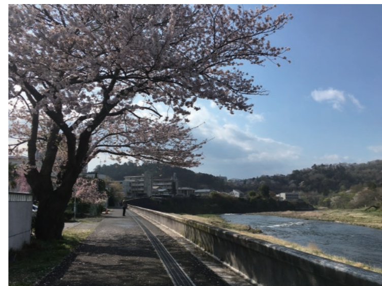
桜や新緑により、日々彩りが変わる