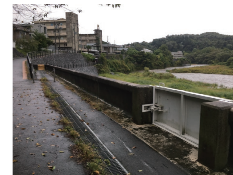
大雨予想時、堤防のゲートが誰かの手によって閉じられている