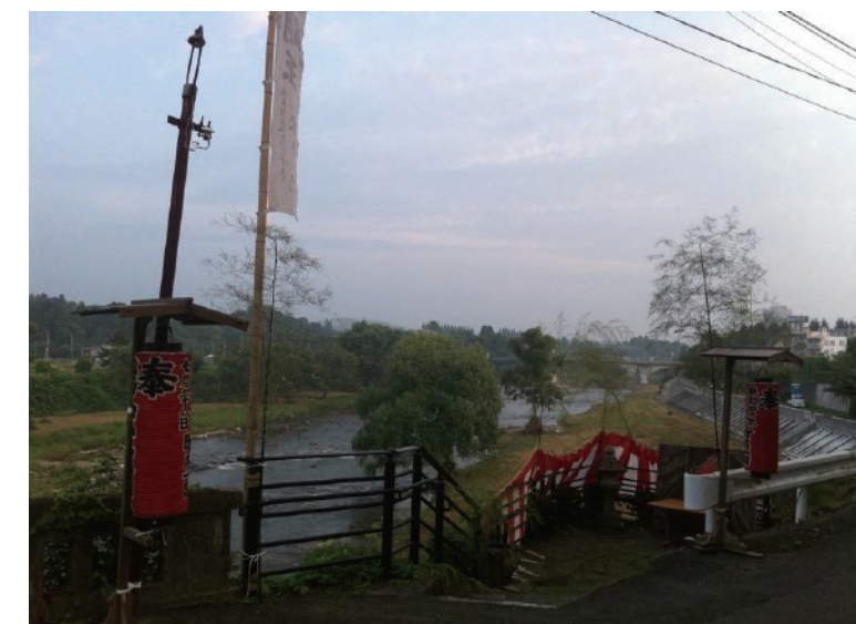
夏祭りの準備が進む