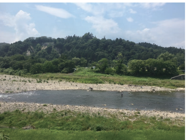
鮎釣り解禁日を過ぎると、ほぼ毎日見る釣り人の姿