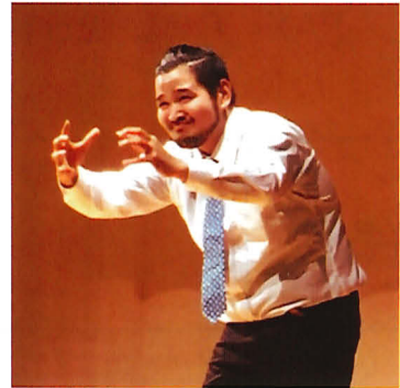
今井彰人（俳優、演出、映画監督）