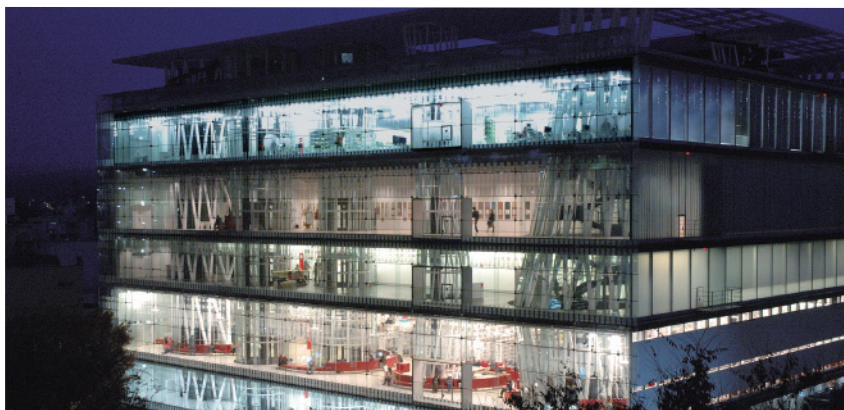
せんだいメディアテーク