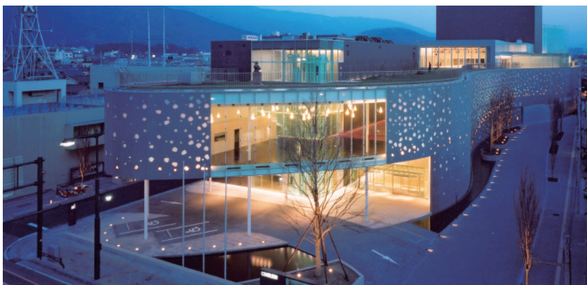
まつもと市民芸術館