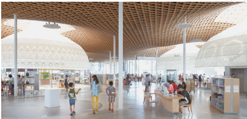
みんなの森 ぎふメディアコスモス (© 中村絵)