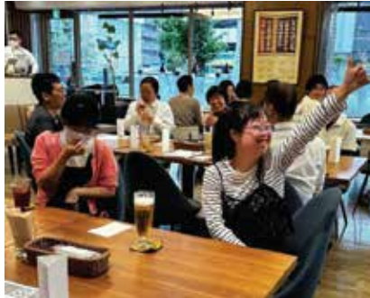
▲お酒とのつきあい方をまなぼう！