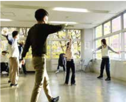
▲声と身体のワークショップ～声と踊りで表現しよう！